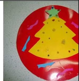
Fin du trimestre : Noël en couleurs.....